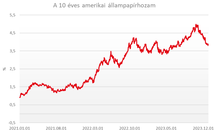
A 10 éves amerikai állampapírhozam a Fed lazább kommunikációja után csökkent

A nyersanyagok gyenge évet zártak a csökkenő infláció és a feldolgozóipar gyengélkedése miatt, a BCOM index az első negyedévben 6%-ot esett. A nemesfémek az év elején felülteljesítettek, ám az emelkedő amerikai kamatok később erősen visszafogták. Az energiahordozók ára az első félévben jelentősen csökkent, a földgáz ára több éves mélypontot is elért, az olajárak az év második felében mutattak növekedést, miután az OPEC+ csökkentette a kitermelési kvótákat.