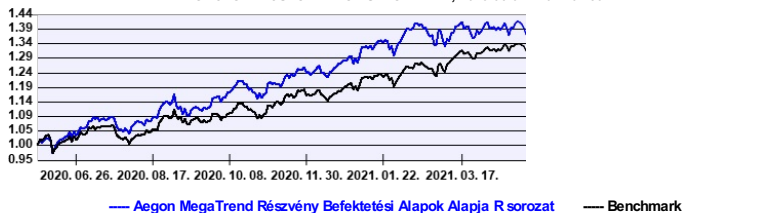
EGY JEGYRE JUTÓ NETTÓ ESZKÖZÉRTÉK, 2020.06.02 - 2021.04.30

A múltbeli hozamok nem jelentenek garanciát az alap jövőbeli teljesítményére nézve. Jelen hirdetés nem minősül ajánlattételnek vagy befektetési tanácsadásnak. A befektetés részletes feltételeit az Alap Tájékoztatója tartalmazza, mely a mindenkor érvényes kondíciós listával együtt megtalálható a forgalmazási helyeiken. A befektetés alap forgalmazásával (vétel, tartás, eladás) kapcsolatos költségek az alap kezelési szabályzatában és a forgalmazási helyeiken megismerhetők.