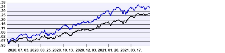
EGY JEGYRE JUTÓ NETTÓ ESZKÖZÉRTÉK, 2020.06.09 - 2021.04.30

A múltbeli hozamok nem jelentenek garanciát az alap jövőbeli teljesítményére nézve. Jelen hirdetés nem minősül ajánlattételnek vagy befektetési tanácsadásnak. A befektetés részletes leírását az Alap Tájékoztatója tartalmazza, mely a mindenkor érvényes kondíciós listákkal együtt megtalálható a forgalmazási helyeken. A befektetés alap forgalmazásával (vétel, tartás, eladás) kapcsolatos költségek az alap kezelési szabályzatában és a forgalmazási helyeken megismerhetők.