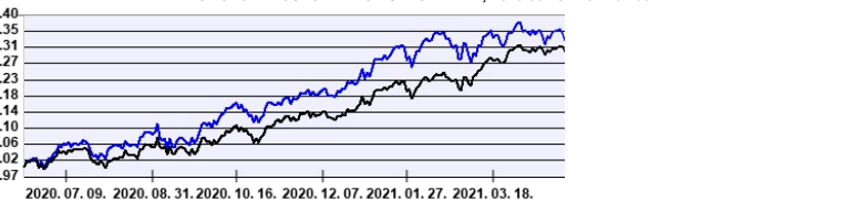
EGY JEGYRE JUTÓ NETTÓ ESZKÖZÉRTÉK, 2020.06.16 - 2021.04.30

A múltbeli hozamok nem jelentenek garanciát az alap jövőbeli teljesítményére nézve. Jelen hirdetés nem minősül ajánlattételnek vagy befektetési tanácsadásnak. A befektetés részletes feltételeit az Alap Tájékoztatója tartalmazza, mely a mindenkor érvényes kondíciós listákkal együtt megtalálható a forgalmazási helyeken. A befektetés alap forgalmazásával (vétel, tartás, eladás) kapcsolatos költségek az alap kezelési szabályzatában és a forgalmazási helyeken megismerhetők.