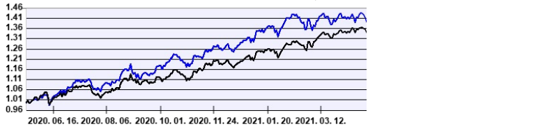
EGY JEGYRE JUTÓ NETTÓ ESZKÖZÉRTÉK, 2020.05.19 - 2021.04.30

— Aegon MegaTrend Részvény Befektetési Alapok Alapja intézményi sorozat — Benchmark A múltbéli hozamok nem jelentenek garanciát az alap jövőbeli teljesítményére nézve. Jelen hirdetés nem minősül ajánlattételnek vagy befektetési tanácsadásnak. A befektetés részletes feltételeit az Alap Tájékoztatója tartalmazza, mely a mindenkor érvényes kondíciós listákkal együtt megtalálható a forgalmazási helyeken. A befektetés alap forgalmazásával (vétel, tartás, eladás) kapcsolatos költségek az alap kezelési szabályzatában és a forgalmazási helyeken megismerhetők.