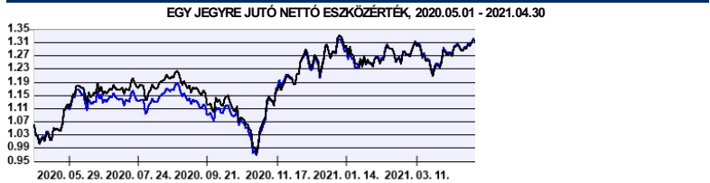
— Aegon Lengyel Részvény Befektetési Alap HUF sorozat — Benchmark

A múltbeli hozamok nem jelentenek garanciát az alap jövőbeli teljesítményére nézve. Jelen hirdetés nem minősül ajánlattételnek vagy befektetési tanácsadásnak. A befektetés részletes feltételeit az Alap Tájékoztatója tartalmazza, mely a mindenkor érvényes kondíciós listával együtt megtalálható a forgalmazási helyeken. A befektetési alap forgalmazásával (vétel, tartás, eladás) kapcsolatos költségek az alap kezelési szabályzatában és a forgalmazási helyeken megismerhetők.