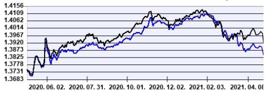
EGY JEGYRE JUTÓ NETTÓ ESZKÖZÉRTÉK, 2020.05.01 - 2021.04.30

— Aegon Lengyel Kötvény Befektetési Alap intézményi sorozat — Benchmark