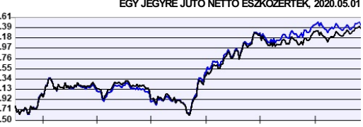
EGY JEGYRE JUTÓ NETTÓ ESZKÖZÉRTÉK, 2020.05.01 - 2021.04.30

A múltbeli hozamok nem jelentenek garanciát az alap jövőbeli teljesítményére nézve. Jelen hirdetés nem minősül ajánlattételnek vagy befektetési tanácsadásnak. A befektetés részletes feltételeit az Alap Tájékoztatója tartalmazza, mely a mindenkor érvényes kondíciós listákkal együtt megtalálható a forgalmazási helyeken. A befektetés alap forgalmazásával (vétel, tartás, eladás) kapcsolatos költségek az alap kezelési szabályzatában és a forgalmazási helyeken megismerhetők.