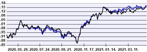
EGY JEGYRE JUTÓ NETTÓ ESZKÖZÉRTÉK, 2020.05.01 - 2021.04.30

— Aegon Közép-Európai Részvény Befektetési Alap CZK sorozat — Benchmark