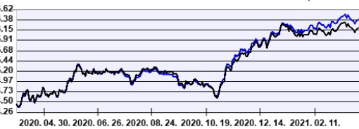
EGY JEGYRE JUTÓ NETTÓ ESZKÖZÉRTÉK, 2020.04.01 - 2021.03.31

— Aegon Közép-Európai Részvény Befektetési Alap intézményi sorozat — Benchmark