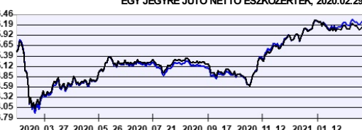
EGY JEGYRE JUTÓ NETTÓ ESZKÖZÉRTÉK, 2020.02.29 - 2021.02.28

A múltbeli hozamok nem jelentenek garanciát az alap jövőbeli teljesítményére nézve. Jelen hirdetés nem minősül ajánlattételnek vagy befektetési tanácsadásnak. A befektetés részletes feltételeit az Alap Tájékoztatója tartalmazza, mely a mindenkor érvényes kondíciós listákkal együtt megtalálható a forgalmazási helyeken. A befektetés alap forgalmazásával (vétel, tartás, eladás) kapcsolatos költségek az alap kezelési szabályzatában és a forgalmazási helyeken megismerhetők.