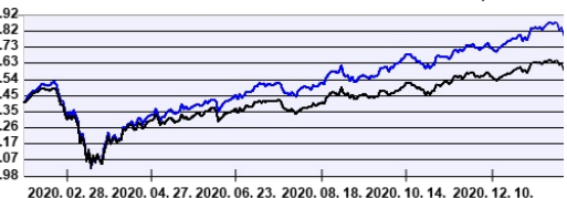
— Aegon MegaTrend Részvény Befektetési Alapok Alapja HUF sorozat — Benchmark

A múltbeli hozamok nem jelentenek garanciát az alap jövőbeli teljesítményére nézve. Jelen hirdetés nem minősül ajánlattételnek vagy befektetési tanácsadásnak. A befektetés részletes feltételeit az Alap Tájékoztatója tartalmazza, mely a mindenkor érvényes kondíciós listával együtt megtalálható a forgalmazás helyein. A befektetési alap forgalmazásával (vétel, tartás, eladás) kapcsolatos költségek az alap kezelési szabályzatában és a forgalmazás helyein megismerhetők.