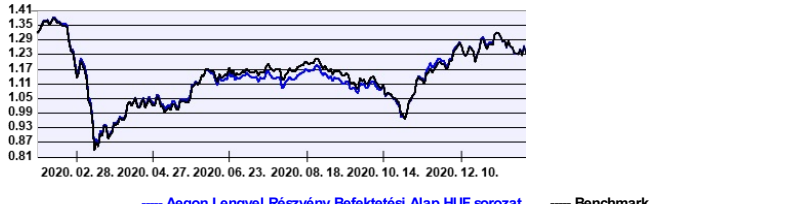
A SZOROZAT TELJESÍTMÉNYE AZ ELMÚLT 12 HÓNAPBAN EGY JEGYRE JUTÓ NETTÓ ESZKÖZÉRTÉK, 2020.02.01 - 2021.01.31

A múltbeli hozamok nem jelentenek garanciát az alap jövőbeli teljesítményére nézve. Jelen hirdetés nem minősül ajánlattételnek vagy befektetési tanácsadásnak. A befektetés részletes feltételeit az Alap Tájékoztatója tartalmazza, mely a mindenkor érvényes kondíciós listákkal együtt megtalálható a forgalmazási helyeiken. A befektetés alap forgalmazásával (vétel, tartás, eladás) kapcsolatos költségek az alap kezelési szabályzatában és a forgalmazási helyeiken megismerhetők.