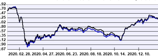
EGY JEGYRE JUTÓ NETTÓ ESZKÖZÉRTÉK, 2020.02.01 - 2021.01.31

A múltbeli hozamok nem jelentenek garanciát az alap jövőbeli teljesítményére nézve. Jelen hirdetés nem minősül ajánlattételnek vagy befektetési tanácsadásnak. A befektetés részletes feltételeit az Alap Tájékoztatója tartalmazza, mely a mindenkor érvényes kondíciós listákkal együtt megtalálható a forgalmazási helyelyen. A befektetési alap forgalmazásával (vétel, tartás, eladás) kapcsolatos költségek az alap kezelési szabályzatában és a forgalmazási helyelyen megismerhetők.