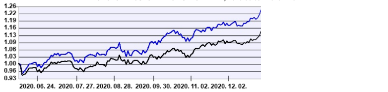
— Aegon MegaTrend Részvény Befektetési Alapok Alapja PI sorozat — Benchmark

A múltbeli hozamok nem jelentenek garanciát az alap jövőbeli teljesítményére nézve. Jelen hirdetés nem minősül ajánlattételnek vagy befektetési tanácsadásnak. A befektetés részletes feltételeit az Alap Tájékoztatója tartalmazza, mely a mindenkor érvényes kondíciós listákkal együtt megtalálható a forgalmazási helyeken. A befektetés alap forgalmazásával (vétel, tartás, eladás) kapcsolatos költségek az alap kezelési szabályzatában és a forgalmazási helyeken megismerhetők.