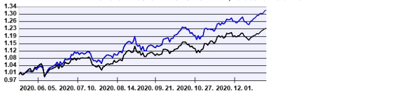
EGY JEGYRE JUTÓ NETTÓ ESZKÖZÉRTÉK, 2020.05.19 - 2020.12.31

— Aegon MegaTrend Részvény Befektetési Alapok Alapja intézményi sorozat — Benchmark A múltbeli hozamok nem jelentenek garanciát az alap jövőbeli teljesítményére nézve. Jelen hirdetés nem minősül ajánlattételnek vagy befektetési tanácsadásnak. A befektetés részletes feltételeit az Alap Tájékoztatója tartalmazza, mely a mindenkor érvényes kondíciós listával együtt megtalálható a forgalmazási helyen. A befektetés alap forgalmazásával (vétel, tartás, eladás) kapcsolatos költségek az alap kezelési szabályzatában és a forgalmazási helyen megismerhetők.