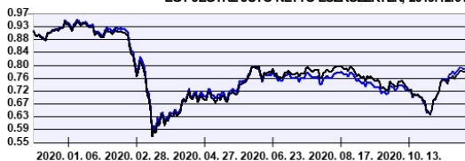
EGY JEGYRE JUTÓ NETTÓ ESZKÖZÉRTÉK, 2019.12.01 - 2020.11.30

— Aegon Lengyel Részvény Befektetési Alap PLN sorozat — Benchmark