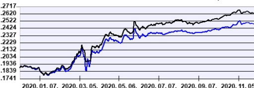
EGY JEGYRE JUTÓ NETTÓ ESZKÖZÉRTÉK, 2019.12.01 - 2020.11.30

— Aegon Lengyel Kötvény Befektetési Alap P sorozat — Benchmark