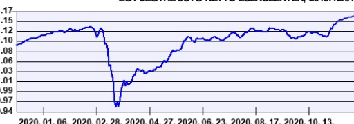
EGY JEGYRE JUTÓ NETTÓ ESZKÖZÉRTÉK, 2019.12.01 - 2020.11.30

— Aegon Feltörekvő Európa Kötvény Befektetési Alap intézményi sorozat