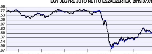
EGY JEGYRE JUTÓ NETTÓ ESZKÖZÉRTÉK, 2019.07.01 - 2020.06.30