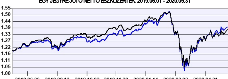
EGY JEGYRE JUTÓ NETTÓ ESZKÖZÉRTÉK, 2019.06.01 - 2020.05.31

Aegon MegaTrend Részvény Befektetési Alapok Alapja HUF sorozat ----- Benchmark A múltbeli hozamok nem jelentenek garanciát az alap jövőbeli teljesítményére nézve. Jelen hirdetés nem minősül ajánlattételnek vagy befektetési tanácsadásnak. A befektetés részletes feltételeit az Alap Tájékoztatója tartalmazza, mely a mindenkor érvényes kondíciós listákkal együtt megtalálható a forgalmazási helyeken. A befektetési alap forgalmazásával (vétel, tartás, eladás) kapcsolatos költségek az alap kezelési szabályzatában és a forgalmazási helyeken megismerhetők.