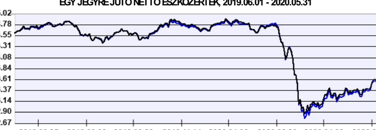
EGY JEGYRE JUTÓ NETTÓ ESZKÖZÉRTÉK, 2019.06.01 - 2020.05.31