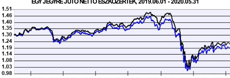
EGY JEGYRE JUTÓ NETTÓ ESZKÖZÉRTÉK, 2019.06.01 - 2020.05.31