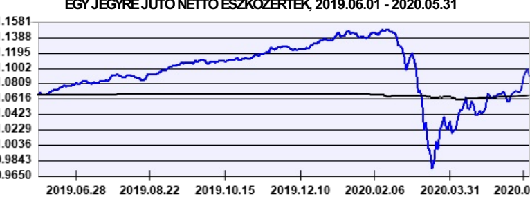
— Aegon Alfa Abszolút Hozamú Befektetési Alap USD sorozat — Benchmark

A múltbeli hozamok nem jelentenek garanciát az alap jövőbeli teljesítményére nézve. Jelen hirdetés nem minősül ajánlattételnek vagy befektetési tanácsadásnak. A befektetés részletes feltételeit az Alap Tájékoztatója tartalmazza, mely a mindenkor érvényes kondíciós listákkal együtt megtalálható a forgalmazási helyeken. A befektetési alap forgalmazásával (vétel, tartás, eladás) kapcsolatos költségek az alap kezelési szabályzatában és a forgalmazási helyeken megismerhetők.