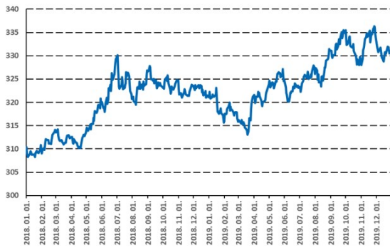
A forint új rekordra gyengült az euróval szemben