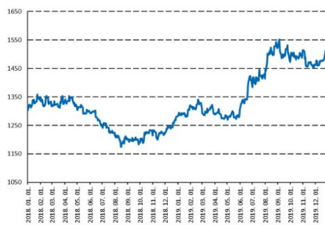
19%-os emelkedés az arany árfolyamában.

A politikai és makrogazdasági bizonytalanság nyertese a 2019-es évben az arany volt, hiszen árfolyama közel 19%-ot emelkedett az év folyamán.