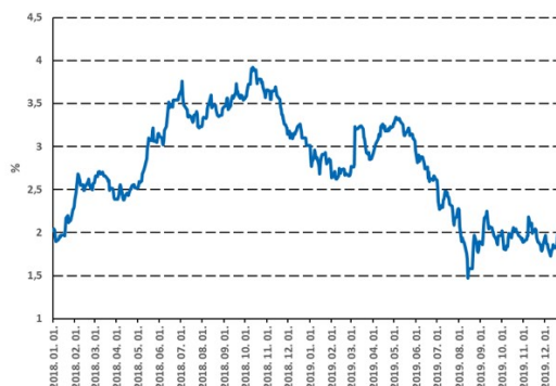
A magyar tízéves kötvényhozamok 2% köré csökkentek