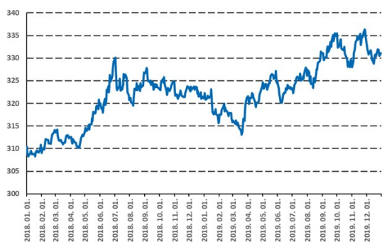
A forint új rekordra gyengült az euróval szemben