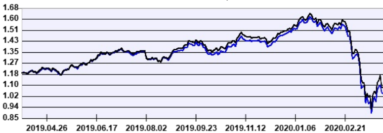
----- Aegon Russia Részvény Befektetési Alap PLN sorozat ----- Benchmark

A múltbeli hozamok nem jelentenek garanciát az alap jövőbeli teljesítményére nézve. Jelen hirdetés nem minősül ajánlattételnek vagy befektetési tanácsadásnak. A befektetés részletes feltételeit az Alap Tájékoztatója tartalmazza, mely a mindenkor érvényes kondíciók listákkal együtt megtalálható a forgalmazási helyeken. A befektetési alap forgalmazásával (vétel, tartás, eladás) kapcsolatos költségek az alap kezelési szabályzatában és a forgalmazási helyeken megismerhetők.