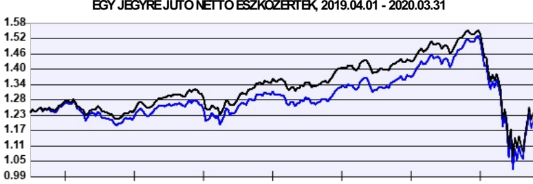
EGY JEGYRE JUTÓ NETTÓ ESZKÖZÉRTÉK, 2019.04.01 - 2020.03.31

----- Aegon MegaTrend Részvény Befektetési Alapok Alapja HUF sorozat ----- Benchmark A múltbeli hozamok nem jelentenek garanciát az alap jövőbeli teljesítményére nézve. Jelen hirdetés nem minősül ajánlattételnek vagy befektetési tanácsadásnak. A befektetés részletes feltételeit az Alap Tájékoztatója tartalmazza, mely a mindenkor érvényes kondíciós listákkal együtt megtalálható a forgalmazási helyeken. A befektetési alap forgalmazásával (vétel, tartás, eladás) kapcsolatos költségek az alap kezelési szabályzatában és a forgalmazási helyeken megismerhetők.