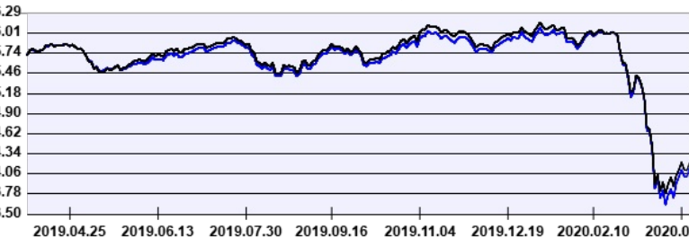
EGY JEGYRE JUTÓ NETTÓ ESZKÖZÉRTÉK, 2019.04.01 - 2020.03.31

----- Aegon Közép-Európai Részvény Befektetési Alap HUF sorozat ----- Benchmark A múltbeli hozamok nem jelentenek garanciát az alap jövőbeli teljesítményére nézve. Jelen hirdetés nem minősül ajánlattételnek vagy befektetési tanácsadásnak. A befektetés részletes feltételeit az Alap Tájékoztatója tartalmazza, mely a mindenkor érvényes kondíciós listákkal együtt megtalálható a forgalmazási helyeken. A befektetési alap forgalmazásával (vétel, tartás, eladás) kapcsolatos költségek az alap kezelési szabályzatában és a forgalmazási helyeken megismerhetők.