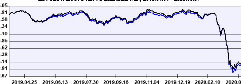
EGY JEGYRE JUTÓ NETTÓ ESZKÖZÉRTÉK, 2019.04.01 - 2020.03.31