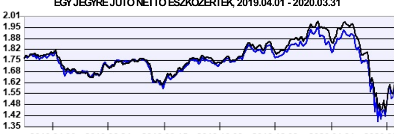
EGY JEGYRE JUTÓ NETTÓ ESZKÖZÉRTÉK, 2019.04.01 - 2020.03.31

A múltbeli hozamok nem jelentenek garanciát az alap jövőbeli teljesítményére nézve. Jelen hirdetés nem minősül ajánlattételnek vagy befektetési tanácsadásnak. A befektetés részletes feltételeit az Alap Tájékoztatója tartalmazza, mely a mindenkor érvényes kondíciós listákkal együtt megtalálható a forgalmazási helyeken. A befektetési alap forgalmazásával (vétel, tartás, eladás) kapcsolatos költségek az alap kezelési szabályzatában és a forgalmazási helyeken megismerhetők.