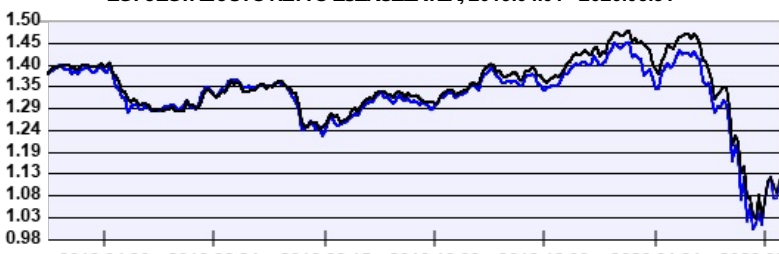
EGY JEGYRE JUTÓ NETTÓ ESZKÖZÉRTÉK, 2019.04.01 - 2020.03.31

A múltbeli hozamok nem jelentenek garanciát az alap jövőbeli teljesítményére nézve. Jelen hirdetés nem minősül ajánlattételnek vagy befektetési tanácsadásnak. A befektetés részletes feltételeit az Alap Tájékoztatója tartalmazza, mely a mindenkor érvényes kondíciós listákkal együtt megtalálható a forgalmazási helyeken. A befektetési alap forgalmazásával (vétel, tartás, eladás) kapcsolatos költségek az alap kezelési szabályzatában és a forgalmazási helyeken megismerhetők.