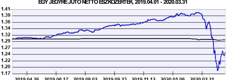
EGYJEGYRE JUTÓ NETTÓ ESZKÖZÉRTÉK, 2019.04.01 - 2020.03.31

----- Aegon Alfa Abszolút Hozamú Befektetési Alap R sorozat ----- Benchmark