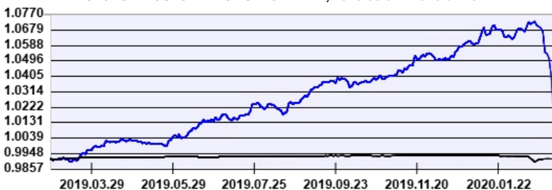
EGY JEGYRE JUTÓ NETTÓ ESZKÖZÉRTÉK, 2019.03.01 - 2020.02.29

— Aegon Alfa Abszolút Hozamú Befektetési Alap CZK sorozat — Benchmark