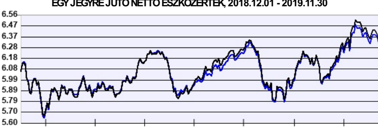
EGY JEGYRE JUTÓ NETTÓ ESZKÖZÉRTÉK, 2018.12.01 - 2019.11.30

— Aegon Közép-Európai Részvény Befektetési Alap intézményi sorozat