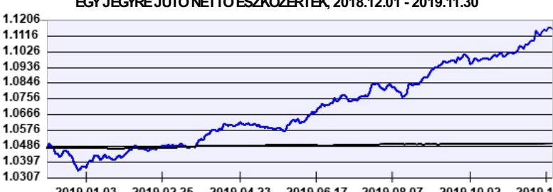
EGY JEGYRE JUTÓ NETTÓ ESZKÖZÉRTÉK, 2018.12.01 - 2019.11.30

Aegon Alfa Abszolút Hozamú Befektetési Alap intézményi sorozat — Benchmark A múltbeli hozamok nem jelentenek garanciát az alap jövőbeli teljesítményére nézve. Jelen hirdetés nem minősül ajánlattételnek vagy befektetési tanácsadásnak. A befektetés részletes feltételeit az Alap Tájékoztatója tartalmazza, mely a mindenkor érvényes kondíciós listákkal együtt megtalálható a forgalmazási helyeken. A befektetési alap forgalmazásával (vétel, tartás, eladás) kapcsolatos költségek az alap kezelési szabályzatában és a forgalmazási helyeken megismerhetők.