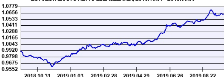
— Aegon Feltörekvő Európa Kötvény Befektetési Alap EUR sorozat

EGY JEGYRE JUTÓ NETTÓ ESZKÖZÉRTÉK, 2018.10.01 - 2019.09.30