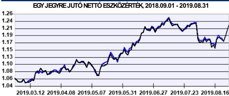
EGY JEGYRE JUTÓ NETTÓ ESZKÖZÉRTÉK, 2018.09.01 - 2019.08.31

— Aegon Russia Részvény Befektetési Alap PI sorozat — Benchmark A múltbeli hozamok nem jelentenek garanciát az alap jövőbeli teljesítményére nézve. Jelen hirdetés nem minősül ajánlattételnek vagy befektetési tanácsadásnak. A befektetés részletes feltételeit az Alap Tájékoztatója tartalmazza, mely a mindenkor érvényes kondíciós listával együtt megtalálható a forgalmazási helyeken. A befektetési alap forgalmazásával (vétel, tartás, eladás) kapcsolatos költségek az alap kezelési szabályzatában és a forgalmazási helyeken megismerhetők.