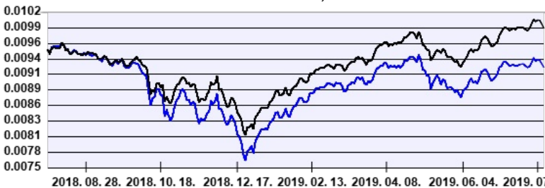
— Aegon MegaTrend Részvény Befektetési Alapok Alapja EUR sorozat ---- Benchmark

A múltbeli hozamok nem jelentenek garanciát az alap jövőbeli teljesítményére nézve. Jelen hirdetés nem minősül ajánlattételnek vagy befektetési tanácsadásnak. A befektetés részletes feltételeit az Alap Tájékoztatója tartalmazza, mely a mindenkor érvényes kondíciós listával együtt megtalálható a forgalmazási helyeken. A befektetési alap forgalmazásával (vétel, tartás, eladás) kapcsolatos költségek az alap kezelési szabályzatában és a forgalmazási helyeken megismerhetők.