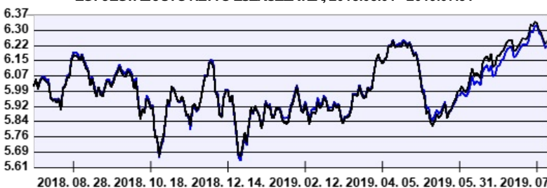
— Aegon Közép-Európai Részvény Befektetési Alap intézményi sorozat - - - Benchmark

A múltbeli hozamok nem jelentenek garanciát az alap jövőbeli teljesítményére nézve. Jelen hirdetés nem minősül ajánlattételnek vagy befektetési tanácsadásnak. A befektetés részletes feltételeit az Alap Tájékoztatója tartalmazza, mely a mindenkor érvényes kondíciós listákkal együtt megtalálható a forgalmazási helyeken. A befektetési alap forgalmazásával (vétel, tartás, eladás) kapcsolatos költségek az alap kezelési szabályzatában és a forgalmazási helyeken megismerhetők.