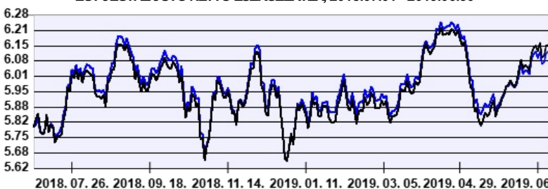
— Aegon Közép-Európai Részvény Befektetési Alap intézményi sorozat ---- Benchmark

A múltbeli hozamok nem jelentenek garanciát az alap jövőbeli teljesítményére nézve. Jelen hirdetés nem minősül ajánlattételnek vagy befektetési tanácsadásnak. A befektetés részletes feltételeit az Alap Tájékoztatója tartalmazza, mely a mindenkor érvényes kondíciós listával együtt megtalálható a forgalmazási helyeken. A befektetési alap forgalmazásával (vétel, tartás, eladás) kapcsolatos költségek az alap kezelési szabályzatában és a forgalmazási helyeken megismerhetők.