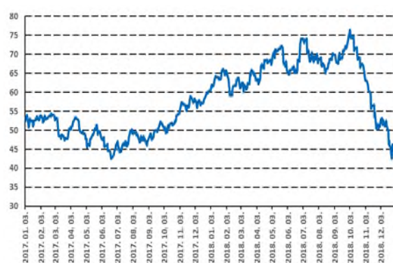
40%-os esés az olajárban