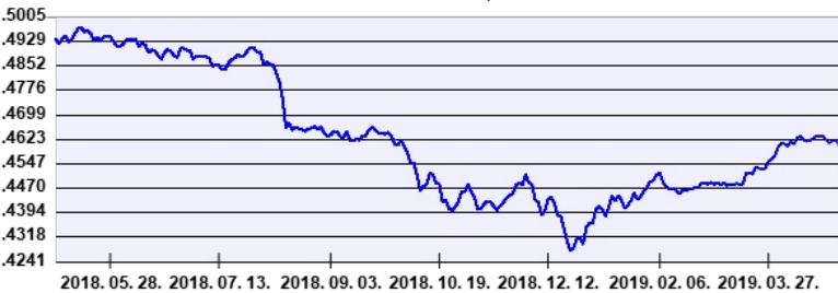
EGY JEGYRE JUTÓ NETTÓ ESZKÖZÉRTÉK, 2018.05.01 - 2019.04.30

----- Aegon Smart Money Befektetési Alapok Alapja ----- Benchmark