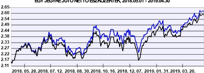
EGY JEGYRE JUTÓ NETTÓ ESZKÖZÉRTÉK, 2018.05.01 - 2019.04.30

----- Aegon Russia Részvény Befektetési Alap HUF sorozat ----- Benchmark A múltbeli hozamok nem jelentenek garanciát az alap jövőbeli teljesítményére nézve. Jelen hirdetés nem minősül ajánlattételnek vagy befektetési tanácsadásnak. A befektetés részletes feltételeit az Alap Tájékoztatója tartalmazza, mely a mindenkor érvényes kondíciós listákkal együtt megtalálható a forgalmazási helyeken. A befektetési alap forgalmazásával (vétel, tartás, eladás) kapcsolatos költségek az alap kezelési szabályzatában és a forgalmazási helyeken megismerhetők.