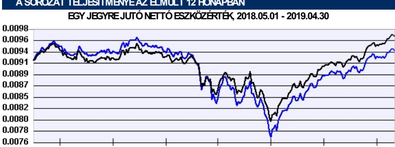
EGY JEGYRE JUTÓ NETTÓ ESZKÖZÉRTÉK, 2018.05.01 - 2019.04.30

----- Aegon MegaTrend Részvény Befektetési Alapok Alapja EUR sorozat ----- Benchmark