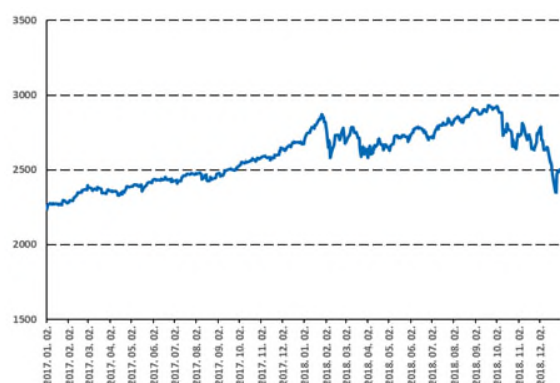
Éves mélyponton az S&P 500