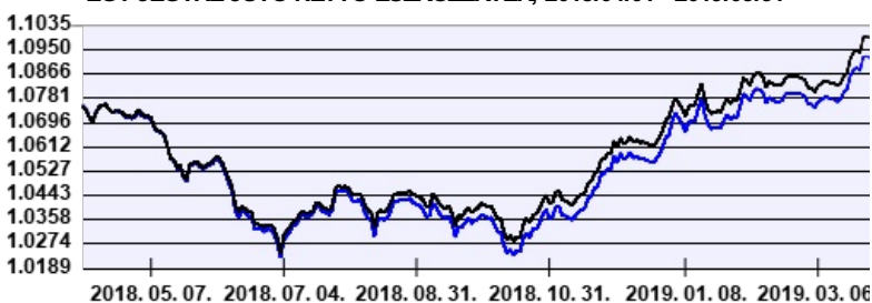
— Aegon Belföldi Kötvény Befektetési Alap intézményi sorozat — Benchmark

A múltbeli hozamok nem jelentenek garanciát az alap jövőbeli teljesítményére nézve. Jelen hirdetés nem minősül ajánlattételnek vagy befektetési tanácsadásnak. A befektetés részletes feltételeit az Alap Tájékoztatója tartalmazza, mely a mindenkor érvényes kondíciós listákkal együtt megtalálható az forgalmazási helyeken. A befektetési alap forgalmazásával (vétel, tartás, eladás) kapcsolatos költségek az alap kezelési szabályzatában és a forgalmazási helyeken megismerhetők.