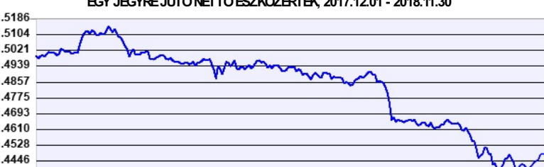
EGY JEGYRE JUTÓ NETTÓ ESZKÖZÉRTÉK, 2017.12.01 - 2018.11.30

----- Aegon Smart Money Befektetési Alapok Alapja ----- Benchmark