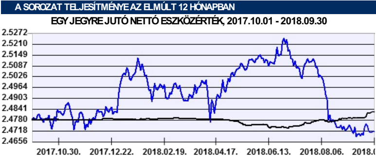
— Aegon Alfa Abszolút Hozamú Befektetési Alap PLN sorozat — Benchmark

A múltbeli hozamok nem jelentenek garanciát az alap jövőbeli teljesítményére nézve. Jelen hirdetés nem minősül ajánlattételnek vagy befektetési tanácsadásnak. A befektetés részletes feltételeit az Alap Tájékoztatója tartalmazza, mely a mindenkor érvényes kondíciós listákkal együtt megtalálható a forgalmazási helyeken. A befektetési alap forgalmazásával (vétel, tartás, eladás) kapcsolatos költségek az alap kezelési szabályzatában és a forgalmazási helyeken megismerhetők.