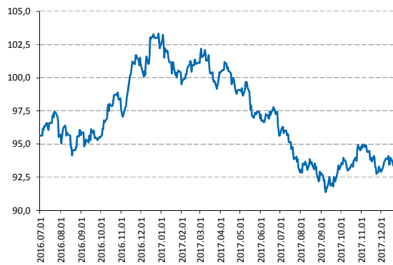
Ismét gyengülő dollár index