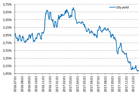
Jelentős hosszú lejáratú hozamcsökkenés